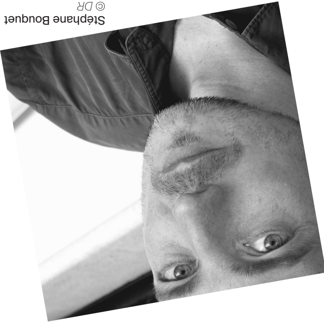
Stéphane Bouquet

MIDIMINUITPOÉSIE #17 est soutenu par la Ville de Nantes, la Région des Pays de la Loire, le Département de Loire-Atlantique, Le Centre National du Livre, la SOFA, la DRAC des Pays de la Loire, l'Institut Français, la Fondation Michalski, Poetry Foundation of Chicago.